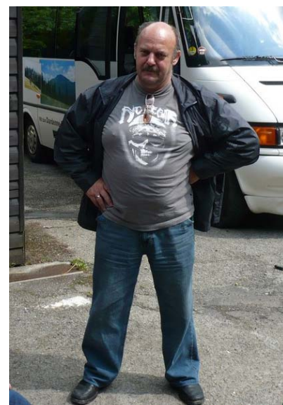
Afronden doet hij met een telefoontje naar de Chinees met de bestelling: "Het moet niet lekker zijn, als het maar veel is".